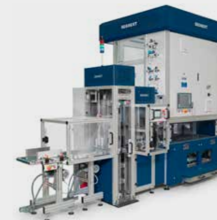
MPA-VVS für vollautomatisches posttroutensortiertes Palettieren. MPA-VVS for fully automatic ZIP code palletizing